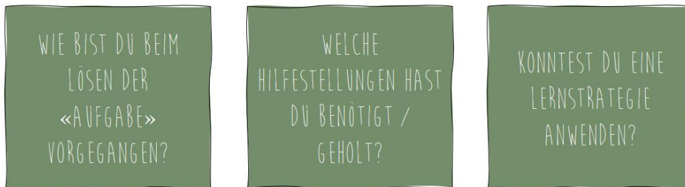
Abbildung 3: Reflexionskärtchen für Lerngespräche